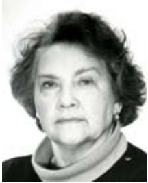
Профессор А.Г. Земская (100 лет со дня рождения)